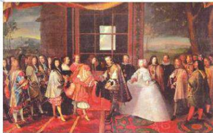
D Laumosnier, Jacques (Siglo XVII). La entrevista de Luis XIV y Felipe IV en la isla de los Faisanes . [Pintura].

Durante los siglos XV y XVI, las monarquías nacionales fortalecieron la concentración del poder en manos de la Corona y, en muchos casos, transitaron hacia el absolutismo. España y Francia fueron los máximos exponentes del absolutismo con los reyes Felipe II y Luis XIV respectivamente.