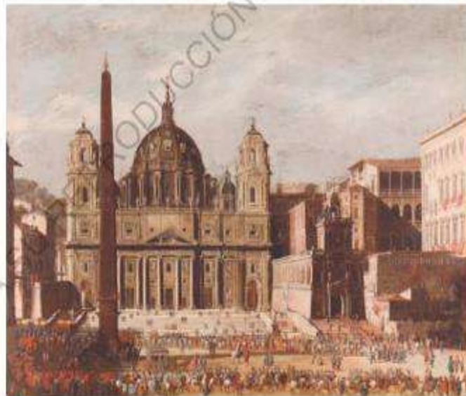
C Codazzi, Viviano (aprox. 1630). Basílica de San Pedro . Roma. [Pintura].

En el ámbito religioso, durante la Edad Moderna se produjo la ruptura de la unidad cristiana de Europa, hasta entonces representada por la Iglesia católica . Este proceso se inició durante el siglo XVI con el movimiento conocido como Reforma religiosa. A partir de la Reforma , la Iglesia católica profundizó un proceso de transformaciones internas que había impulsado desde fines de la Edad Media. Esto se llevó a cabo a través de un concilio (reunión de obispos) convocado por el papa Paulo III, el que tuvo lugar en la ciudad de Trento en 1545, y se extendió, con interrupciones, hasta 1563. Las reformas internas de la Iglesia establecidas durante este periodo se conocen como Contrarreforma católica .