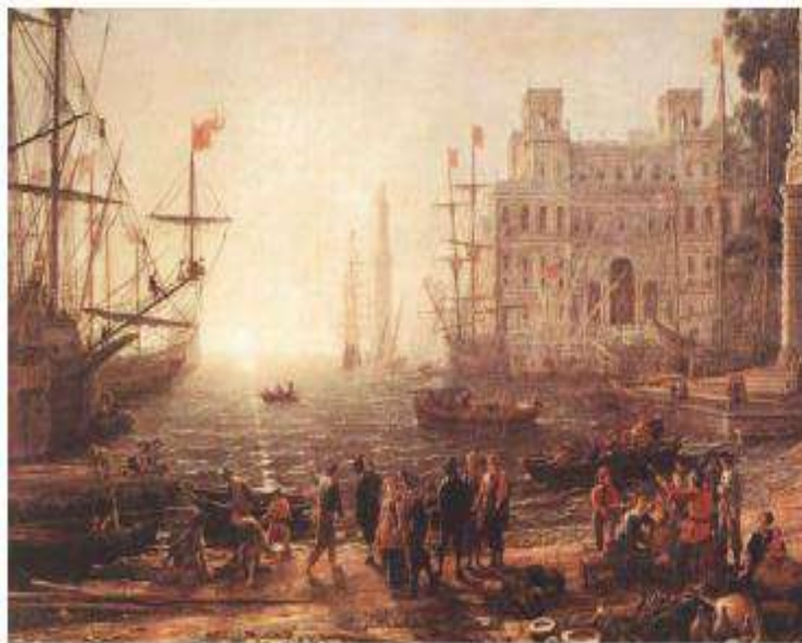
1 Lorenzini, Claudio de (1637) Puerto con la villa Misipi. (Pintura)